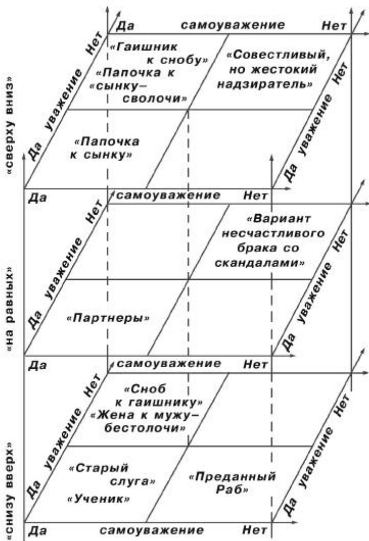
Рис. 2. Относительная значимость различных отношений.