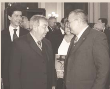
ВСТРЕЧА С ПРЕЗИДЕНТОМ ТОРГОВО-ПРОМЫШЛЕННОЙ ПАЛАТЫ РФ ЕВГЕНИЕМ ПРИМАКОВЫМ