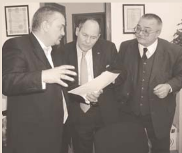
ОБСУЖДЕНИЕ СТРАТЕГИИ РАЗВИТИЯ АУДИТА В РОССИИ С ПРЕЗИДЕНТОМ МЕЖДУНАРОДНОЙ ФЕДЕРАЦИИ БУХГАЛТЕРОВ РЕНЕ РИКОЛЕМ В ОФИСЕ КОМПАНИИ РУФАУДИТ