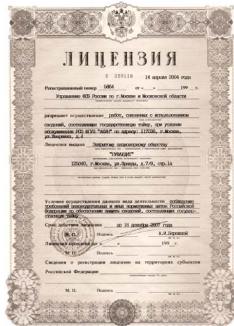
ЛИЦЕНЗИЯ НА ОСУЩЕСТВЛЕНИЕ РАБОТ, СВЯЗАННЫХ С ИСПОЛЬЗОВАНИЕМ СВЕДЕНИЙ, СОСТАВЛЯЮЩИХ ГОСУДАРСТВЕННУЮ ТАЙНУ выдана ЗАО «РУФАУДИТ» Управлением ФСБ России 14 апреля 2004 г.