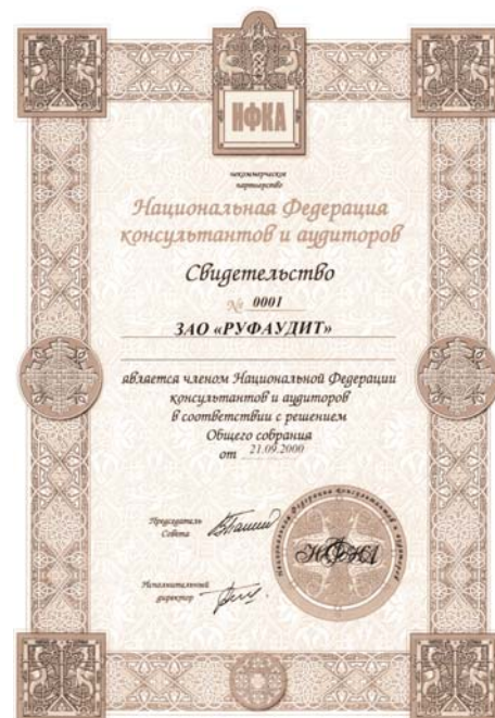
СВИДЕТЕЛЬСТВО №0001: ЗАО «РУФАУДИТ» ЯВЛЯЕТСЯ ЧЛЕНОМ НАЦИОНАЛЬНОЙ ФЕДЕРАЦИИ КОНСУЛЬТАНТОВ И АУДИТОРОВ (НФКА) выдано 21 сентября 2000 г.