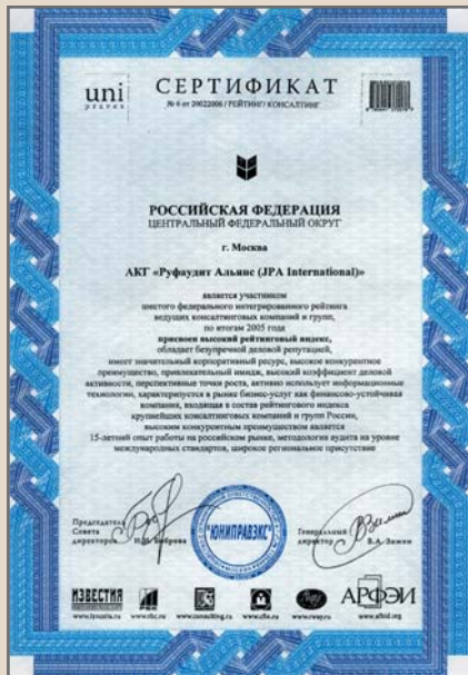
СЕРТИФИКАТ № 6 от 20022006 / РЕЙТИНГ / КОНСАЛТИНГ О ПРИСВОЕНИИ АКГ «РУФАУДИТ АЛЬЯНС» ВЫСОКОГО РЕЙТИНГОВОГО ИНДЕКСА ПО ИТОГАМ 2005 ГОДА НА ШЕСТОМ ФЕДЕРАЛЬНОМ ИНТЕГРИРОВАННОМ РЕЙТИНГЕ ВЕДУЩИХ КОНСАЛТИНГОВЫХ КОМПАНИЙ И ГРУПП