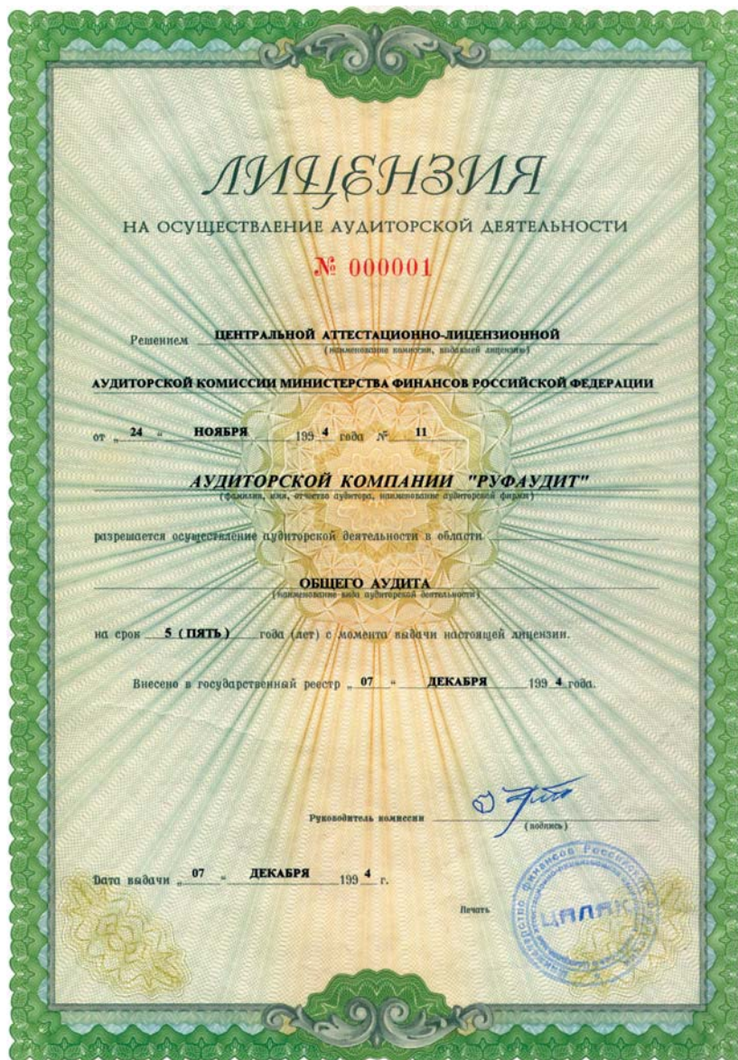
ЛИЦЕНЗИЯ МИНИСТЕРСТВА ФИНАНСОВ РОССИЙСКОЙ ФЕДЕРАЦИИ № 000001 НА ПРАВО ОСУЩЕСТВЛЕНИЯ АУДИТОРСКОЙ ДЕЯТЕЛЬНОСТИ В ОБЛАСТИ ОБЩЕГО АУДИТА, выдана 7 декабря 1994 г.

Управлением ФСБ России по г. Москве и Московской области ЗАО «РУФАУДИТ» выдана лицензия от 14 апреля 2004 года № Б 329118 (регистрационный номер № 5864) на осуществление работ, связанных с использованием сведений, составляющих государственную тайну, сроком действия до 16 декабря 2007 года.