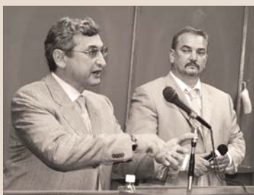
ОБСУЖДЕНИЕ ПРОЕКТА ФЕДЕРАЛЬНОГО ЗАКОНА «ОБ АУДИТОРСКОЙ ДЕЯТЕЛЬНОСТИ» С ПРЕДСЕДАТЕЛЕМ КОМИТЕТА ПО СОБСТВЕННОСТИ ГОСДУМЫ ВИКТОРОМ ПЛЕСКАЧЕВСКИМ НА КОНФЕРЕНЦИИ РКА