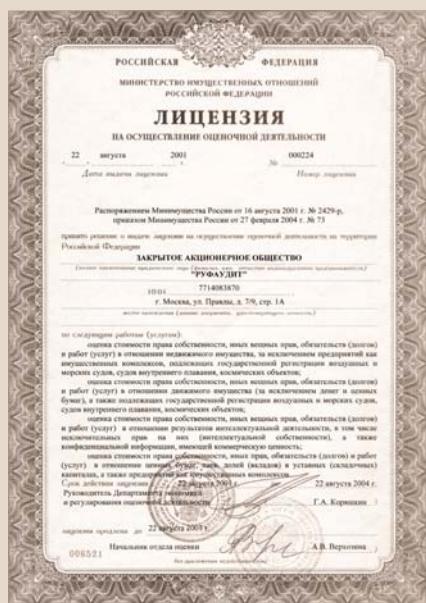
ЛИЦЕНЗИЯ НА ОСУЩЕСТВЛЕНИЕ ОЦЕНОЧНОЙ ДЕЯТЕЛЬНОСТИ ВЫДАНА ЗАО «РУФАУДИТ» МИНИСТЕРСТВОМ ИМУЩЕСТВЕННЫХ ОТНОШЕНИЙ РФ