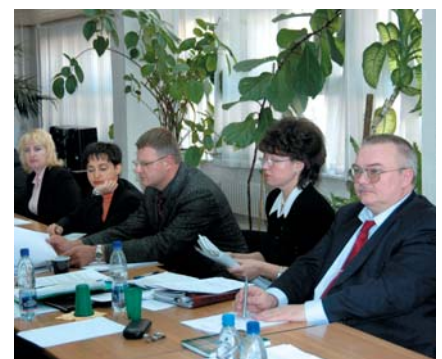
ПРОВЕДЕНИЕ ЗАСЕДАНИЯ СОВЕТА НАЦИОНАЛЬНОЙ ФЕДЕРАЦИИ КОНСУЛЬТАНТОВ И АУДИТОРОВ В МОСКВЕ