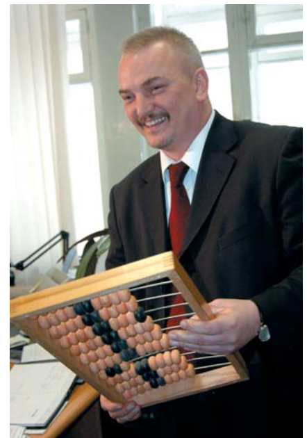
ПОДВЕДЕНИЕ ИТОГОВ КОНКУРСА НА ЗВАНИЕ «ЛУЧШИЙ АУДИТОР» РОССИЙСКОЙ КОЛЛЕГИИ АУДИТОРОВ