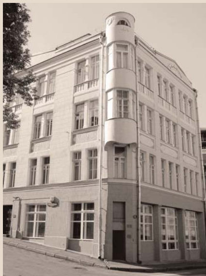
ЗДАНИЕ ОФИСА КОМПАНИИ РУФАУДИТ