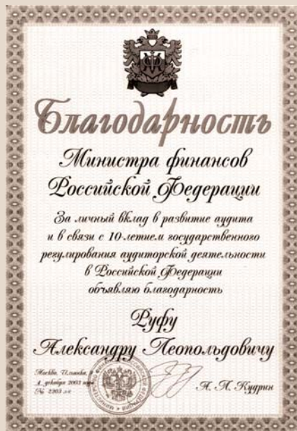
БЛАГОДАРНОСТЬ А.Л.РУФУ ОТ МИНИСТРА ФИНАНСОВ РОССИИ А.Л. КУДРИНА: «ЗА ЛИЧНЫЙ ВКЛАД В РАЗВИТИЕ АУДИТА...»