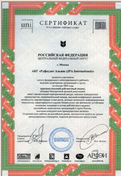
СЕРТИФИКАТ № 5 от 20022006 / РЕЙТИНГ / АУДИТ О ПРИСВОЕНИИ АКГ «РУФАУДИТ АЛЬЯНС» ВЫСОКОГО РЕЙТИНГОВОГО ИНДЕКСА ПО ИТОГАМ 2005 ГОДА НА ПЯТОМ ФЕДЕРАЛЬНОМ ИНТЕГРИРОВАННОМ РЕЙТИНГЕ ВЕДУЩИХ АУДИТОРСКИХ ОРГАНИЗАЦИЙ И ГРУПП