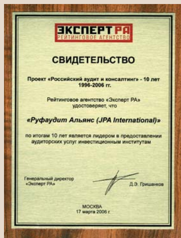
СВИДЕТЕЛЬСТВО РЕЙТИНГОВОГО АГЕНТСТВА «ЭКСПЕРТ РА» О ТОМ, ЧТО «РУФАУДИТ АЛЬЯНС» ПО ИТОГАМ 10 ЛЕТ ЯВЛЯЕТСЯ ЛИДЕРОМ В ПРЕДОСТАВЛЕНИИ АУДИТОРСКИХ УСЛУГ ИНВЕСТИЦИОННЫМ ИНСТИТУТАМ 17 марта 2006 года